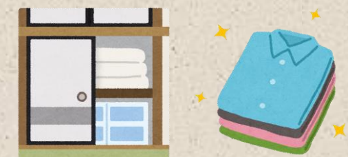
※Panasonic のホームページから抜粋